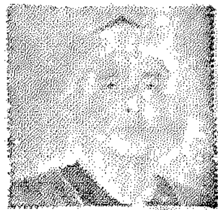
الشيخ مصطفى اسماعيل